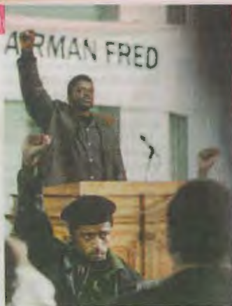
A TIEMPO. La cinta llega para celebrar y educar en el Mes de la Historia Afroamericana.

Estrena la película verídica "Judas and the Black Messiah"